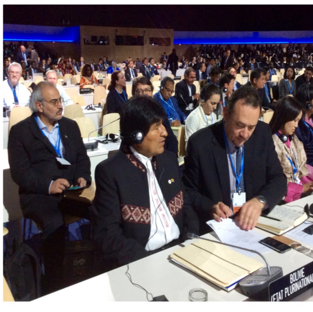
Durante la intervención de los jefes de Estado.

“No podemos mantener el silencio cómplice frente a la catástrofe planetaria que se avecina y tampoco podemos hablar de prudencia cuando estamos en el umbral de la destrucción asegurada. El capitalismo ha fomentado, ha introducido y ha impulsado, en estos dos últimos siglos, la forma más salvaje y destructiva de nuestra especie convirtiendo todo en mercancía para beneficio de unos cuantos”.