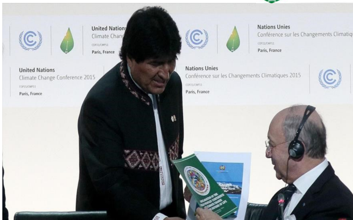
Entrega de las conclusiones de la II Conferencia Mundial de los Pueblos sobre Cambio Climático y Defensa por la Vida.

PARIS2015 UN CLIMATE CHANGE CONFERENCE COP21-CMP11