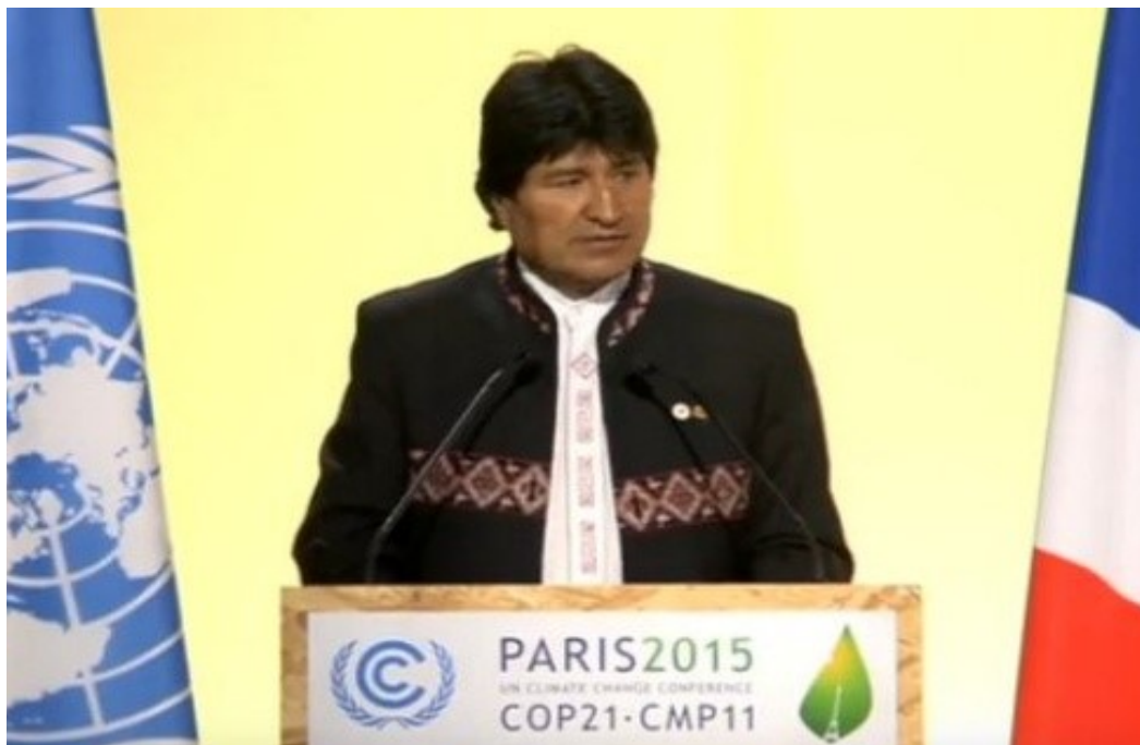
Presidente de Bolivia durante su discurso.

El presidente Evo Morales llamó a las potencias mundiales a cesar la destrucción del planeta y advirtió que “si continuamos el camino trazado por el capitalismo, estamos condenados a desaparecer”.